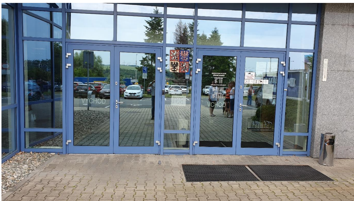
Obr. 2 Bezbariérový vstup do budovy soudu