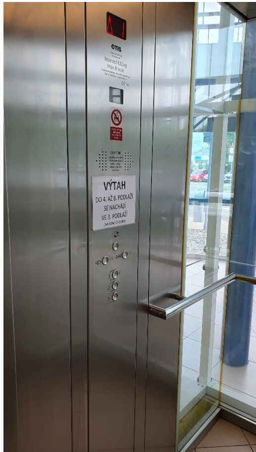
Obr. 4. Pohled na řídicí panel proskleného výtahu