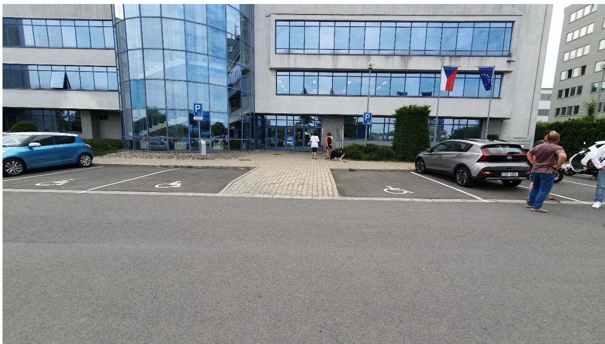
Obr. 1 Vyhrazené parkovací stání před budovou soudu