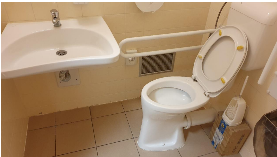
Obr. 9 Bezbariérové WC – detail umývadlo