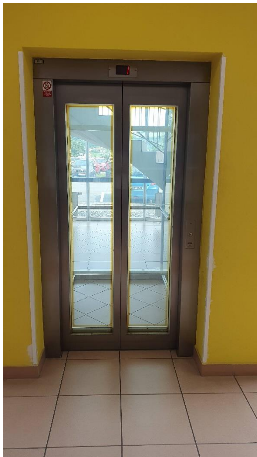
Obr. 3 Stanice proskleného výtahu v 1.NP