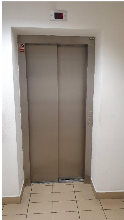
Obr. 5 Pohled na osobní výtah v 1. NP